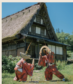
富山の秋まつりを 代表する こきりこ

秋の気配を感じたら、長く暮らしの中に息づいてきた祭りの季節。哀切なメロディに乗せて舞う踊り手の姿に、自分の中のDNAが呼び覚まされそう。美しい衣装や古代から伝わる楽器も民謡民舞ならではの醍醐味です。