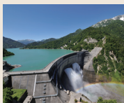
写真：黒部ダム(観光放水)