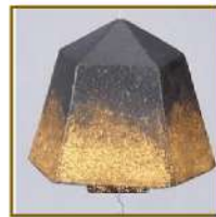
パッションゴールド

チョコレート色の漆面と金箔を施した面がランダムに配置されたりズミカルな色合いです。