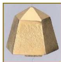
スペシャルゴールド