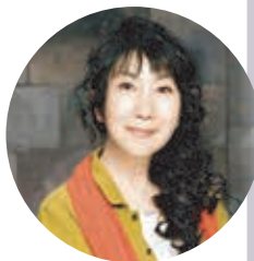
高志の国文学館館長 室井 滋

○日時：6月4日(日)15:00～16:00 ○会場：日本橋とやま館 和食レストラン「富山はま作」 ○参加費：4,000円(税込)現金のみ ※富山の食材がたっぷりお弁当と地酒(又はソフトドリンク)付 ○定員：30名 日本橋とやま館 WEB サイトからお申込みください。