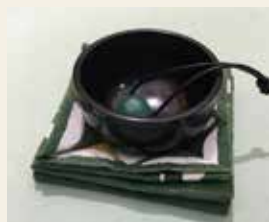
おともりん(山口久乗)5,280円(税込)

伝統の技をさらに磨き続けた職人技は新しいヒット商品も生んでいます。錫100パーセントの曲がる器やタンブラーは人気の商品。中でもピアタンブラーは飲み物を冷たいまま楽しめる逸品です。また、金属と木を組み合わせたモダンな食器や、仏具である「おりん」の音色のリラックス効果を生かしたインテリア小物なども生み出されています。