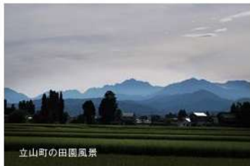
立山町の田園風景