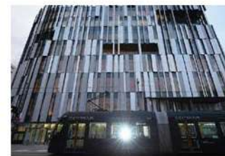
ANA機内誌に掲載された富山の写真

右) ANAの国際便で配布された富山をPRする冊子の中で使われた1カット。富山の風景には見えないが、実はガラス美術館とポートラムを撮影している。中) 写真家としての活動30周年の節目として2020年12月に出版した写真集。アメリカ(ニューヨーク)、フランス、アフリカ(ボツワナ)、タヒチ、カウアイ島、山梨県(富士山)、屋久島などで撮られた作品を収録。右) 東京やオンラインで実施するものと、地方を訪ねて開催する2つの写真教室を主催。前者では人の心をつむぐ写真の秘訣を、後者では、技術習得を通して、地元を好きになる体験を伝えている。