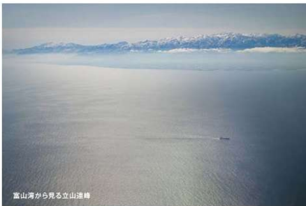
富山湾から見る立山連峰