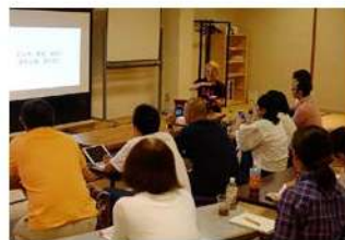
富山で行われた写真教室

1954年、富山市生まれ。日本実業出版社を経て1991年に独立。ポートレート、風景、プロダクトから空間まで、独自の表現手法で常に注目を集める写真家。中でも、ポートレート作品においてはこれまで6000人以上の俳優、モデル、タレント、経営者などの著名人を撮影。モノやコトの“隠れた本質”を捉える着眼点や斬新な表現手法に、イベントプロデューサーから、町興しのオファーも集まる。カルティエの撮影や米国マサチューセッツ工科大学で講演するなど、海外からも高い評価を得る。www.terauchi.com