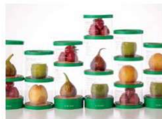
埋没林博物館に出店した「KININAL」

http://eventregist.com/e/toyama54 上記より必要事項をご記入の上お申し込みください。