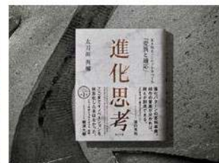
『進化思考』(海士の風、2021年)