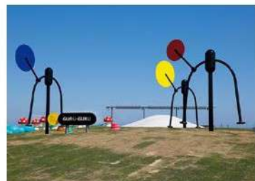
「富山県美術館」オノマトペの屋上(富山市)