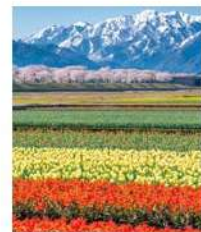
春の四重奏(下新川郡朝日町)

右) 富山県内の風景を本格的に撮りはじめた、当初の一枚。新川郡朝日町の舟川沿いの一面に咲くチューリップ、菜の花、ソメイヨシノと立山連峰が重なって見える絶景で、4月上旬にだけ楽しめる。中)「立山連峰を背景に飛ぶ飛行機が撮れる、写真好きには有名なスポットです。季節によって立山に日の当たる時間や角度が変わるので、タイミングを研究して撮影しました」 左) 息子さんがこれから6年間使うランドセルをかつて走っている写真で、土屋鞆2019ランドセルフォトコンテストで大賞受賞。