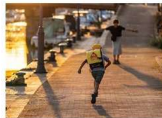
原点にある家族写真