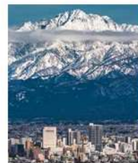
立山連峰と飛行機(富山市)