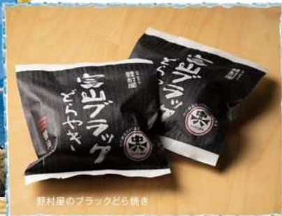
野村屋のブラックどら焼き

右) 富山名物「ブラックラーメン」から考案された一品。「醤油とバター味のバランスが絶妙！」 左) 海越しに見える3000m級の立山連邦が美しい名所。「富山に来たらぜひ立ち寄って」