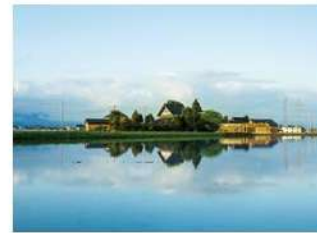
となみ野オーベルジュ