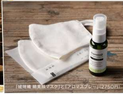
「滅菌織 絹美顔マスク」と「アロマスプレー」(2750円)