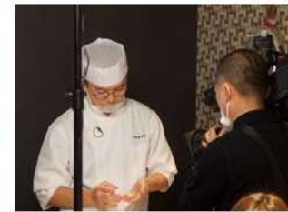
Online TOYAMA Travel