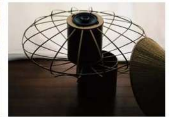
Creators Meet TAKAOKA

右) 2017年に開催した「工芸ハッカソン」から発展し、現在は県外クリエイターと県内の工房によるプロダクトを開発中。 中) オンラインツアーと物販を組み合わせた旅行商品を販売。第一回は茶道人口の割合が全国第2位という富山の 歴史を知るツアー。「引網香月堂」の和菓子と四津川製作所のアルミ菓子切りをセットにして、ツアー中にリクエストに 応じたオリジナル和菓子制作を実演した。左) 砺波平野にオーベルジュを準備中。2022年春～夏オープン予定。