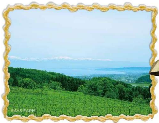
右) 高岡の真鍮鋳物メーカー「二上」とデザイナーの太治将典さんが立ち上げたブランド。 左) 氷見のワイナリー「SAYS FARM」。「こだわりが細部まで感じられ、場所としてとてもおもしろい」(ナガオカさん)