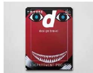
「d design travel TOYAMA」