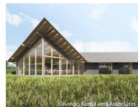
「Healthian-wood」のレストラン外観