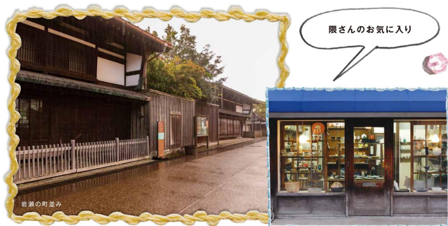
隈さんが好きなエリアは、江戸初期の建物が多く残る「岩瀬地区」。 買い物なら、富山市・総曲輪商店街のクラフト店「林ショップ」がおすすめとか。