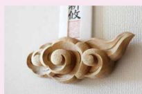
木目の味わいもまた一興 雲棚（ここかしこ）

表面を彫りながら、同様の工程を裏面にも施す。この際、表面を鏡で映し、穴あけした隙間から表と裏がずれないように彫っていく。