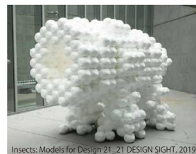
「虫展」での出展作品より『磁石の巣』

1954年、神奈川県生まれ。建築家。東京大学教授。 1964年の東京オリンピック時に見た丹下健三の代々 木屋内競技場に衝撃を受け、幼少期より建築家を目指す。 大学では、原広司、内田祥哉に師事し、大学院時代は、 アフリカのサハラ砂漠を横断。集落の調査を行い、 集落の美と力に目覚める。1979年、東京大学大学院 建築学専攻修了。コロンビア大学客員研究員を経て、 1990年、隈研吾建築都市設計事務所を設立。これまで 20カ国以上で建築を設計し、国内外でさまざまな 賞を受賞している