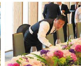
総理官邸 フランス大統領公式昼食会卓上装花