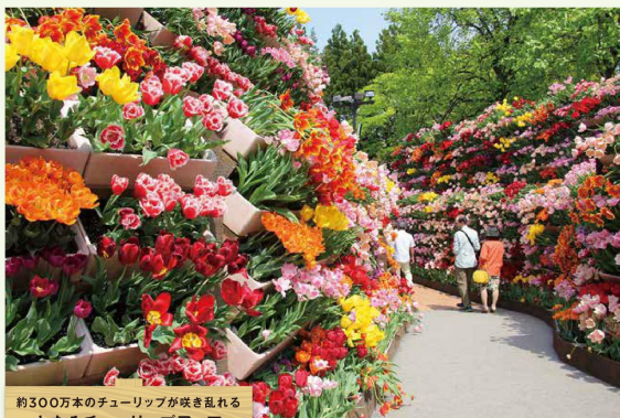
約300万本のチューリップが咲き乱れる となみチューリップフェア

期間：4月22日(月)～5月5日(日) 会場：砺波 チューリップ公園 料金：大人1000円