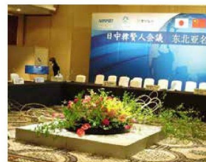
ザ・ウインザーホテル洞爺 日中韓賢人会議における和の会場装花