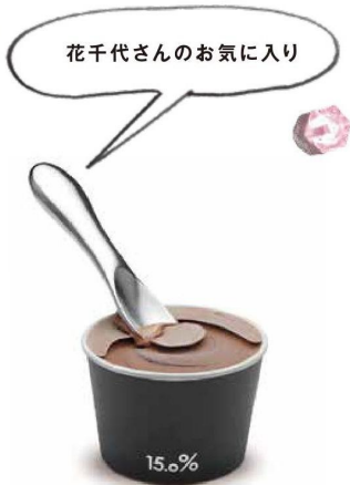
アイスクリームスプーン「15.0%」

アイスクリームスプーン「15.0%」は、ご自身のブログでも取り上げるほど感動したそう！ 海外の方への日本のなお土産として喜ばれるのはかたちが変化したオブジェ的な要素もある「KAGO」。