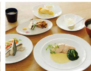
SAYS FARM KITCHEN