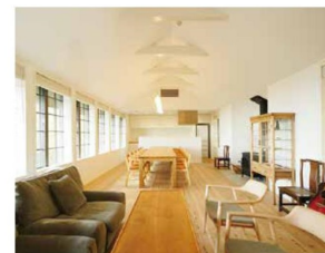
SAYS FARM STAY