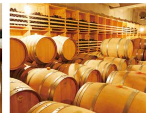
SAYS FARM Albarino 2018

右) カベルネやシャルドネに加え、スペインの海沿い、ポルトガルに近いリアス・バイシャスのブドウの品種「アルバリニョ」を、SAYS FARMでも2012年から栽培をスタートした。氷見の土地との相性もよく、近年栽培面積を増やしているそう。中) ワインに合わせ、氷見の魚介を中心に、自社農園で採れた素材を使った料理を提供する。左) 最大9名までが宿泊できる一棟を借り切る貸別荘のように滞在することができる